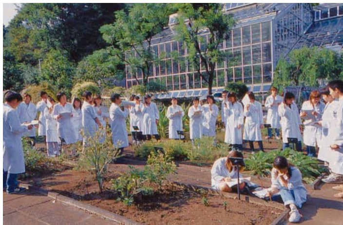
全国有数の規模を誇る薬用植物園

しかし、同薬大の最も大きな特色は、神奈川県川崎市にあり、同じ小田急沿線にある聖マリアンナ医大と連携し、6年制にふさわし