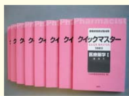
『クイックマスター』

■発行所 株式会社 評言社 (TEL03-3256-6701 http://www.hyogensha.co.jp )