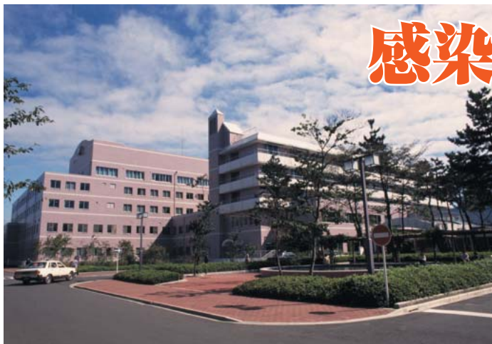
北里大学東病院全景