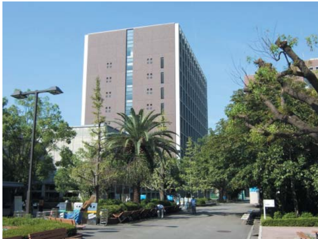
緑濃いキャンパスに建設された10階建ての薬学部校舎

四国で4番目の薬学部として今春、愛媛県の松山大学（松山市）に薬学部医療薬学科が新設された。約160人の新入生が、10階建ての真新しい校舎で学んでいる。文系4学部を擁し、充実した人文・社会科学系科目を生かして、幅広い教養や倫理観、英語力を養うほか、基礎医学と医療薬学のバランスの取れた専門教育などを通じて、質の高い薬剤師の輩出や、薬学関連分野で活躍できる人材の養成を目指すという。研究にも力を入れ、地域医療だけでなく地域産業にも貢献したい考えだ。