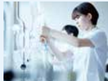
医療保健学部 医療技術学科