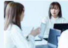
国際コミュニケーション学部 心理社会学科