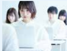
経済経営学部 マネジメント学科