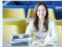
国際コミュニケーション学部 国際コミュニケーション学科